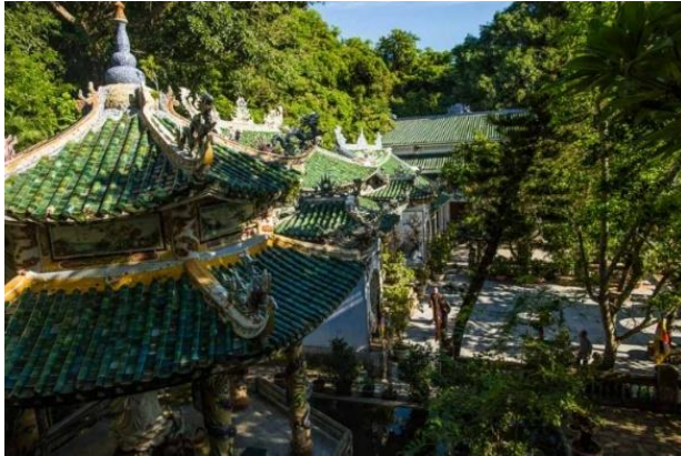
峴港：欣賞巍峨的大理石山， 探索獨特的洞穴和寺廟。

除了前往越南的航線，2024年1月至3月期間，旅客們還可以選擇5晚由香港出發至長灘島及馬尼拉郵輪之旅。這個航線的首站是長灘島，這是備受歡迎且多次獲獎的島嶼之一。在2023年《Conde Nast Traveller Reader's Choice Awards》旅行家雜誌讀者選擇獎中被評為亞洲最佳島嶼前三名，旅客們可以盡情享受無邊無際的細膩白沙灘、澄澈的海水、參與各種充滿樂趣的水上活動和環島之旅等。這是開始您的郵輪假期的完美目的地。