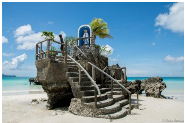
長灘島：聖母岩礁是最受拍攝的地標之一

郵輪下一站來到峴港，讓旅客們更深入瞭解越南這個地方，這是一個備受歡迎的旅遊勝地，旅客可以看到許多美麗的海灘，瞭解當地的占族文化，品嚐獨特美味的街頭食品，探索隱藏式洞穴和迷人神廟的大理石山脈。