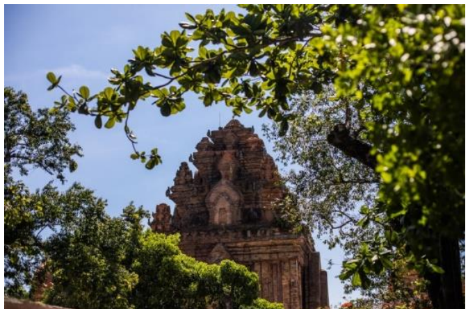
芽莊：引人注目的婆那加占塔

搭乘【名勝世界壹號】的 5 晚芽莊至峴港航線，可以讓您提升度假的體驗，同時也讓乘客沉浸在迷人的自然景觀和海灘、豐富多彩的文化、節日和美食當中。在這個郵輪航線上，首先抵達的是越南的芽莊，這裡對於熱愛陽光的旅客來說簡直是人間天堂，有著如長灘的美麗的海灘，那裡有衝浪熱點和美味的海鮮餐廳。乘客們還可以在泥浴或溫泉中放鬆身心、進行環島之旅、參觀高達 78 英尺的佛像和擁有數百年歷史的婆那加塔等。